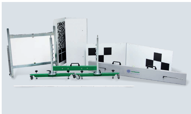
Все калибровочные панели для фронтальных камер теперь можно сложить так, чтобы они не занимали много места

CSC-Tool подходит для всех популярных марок автомобилей. Поэтому, в комбинации с mega max, у покупателя будет возможность проводить калибровку камер и датчиков подавляющего большинства автомобилей. Дополнительный набор расширяет возможности установки, позволяя проводить калибровку камер системы кругового обзора и радарных датчиков. Hella Gutmann постоянно изучает потребности рынка и соответствующим образом дорабатывает предлагаемую продукцию и ее программную составляющую. Мобильная версия калибровочного стенда CSC-Tool – очередное подтверждение того, что Hella Gutmann хорошо понимает потребности рынка. Новинка станет отличным решением для компаний, обслуживающих большие автомобильные парки, специализирующихся на замене автостекла, а также компаний с несколькими автосервисами. CSC-Tool Mobile имеет такую же точность, как и стационарная версия.